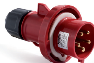
Ref. / Item 14303