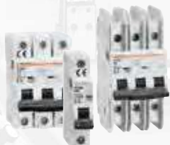
Leitungs-, FI-, FI-/LS-Schutzschalter