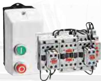
Elektromechanische Motorstarter und Gehäuse