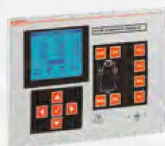
Generator- und Motorsteuerungen