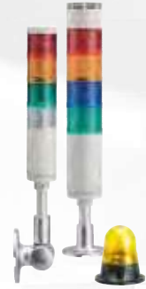
Signalsäulen und Leuchtmelder