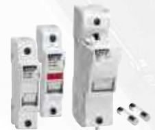
Sicherungshalter und Sicherungen