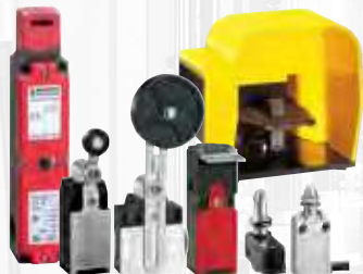
Positionsschalter, Mikroschalter und Fußschalter