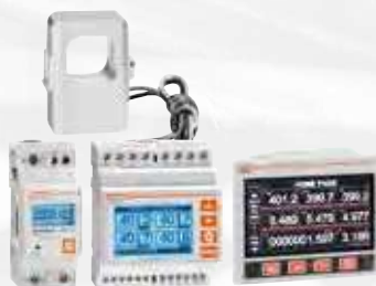
Messinstrumente und Stromwandler