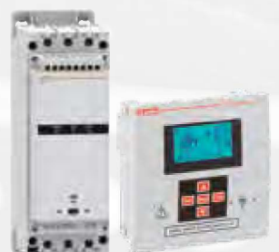
Blindleistungsregler und Thyristormodule