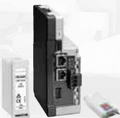
Erweiterungsmodule und Zubehör