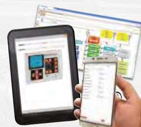
Software und Anwendungen