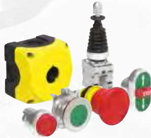
Befehls- und Meldegeräte