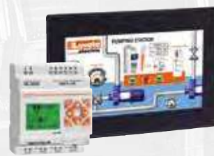
Micro-SPS und HMI